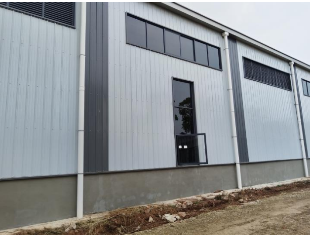
项目建筑物区现状（拍摄时间2024年11月）