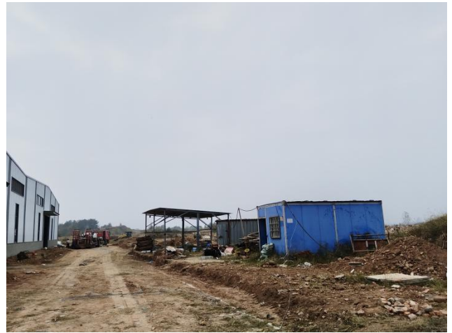
项目施工场地区现状（拍摄时间2024年11月）