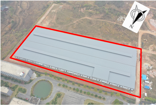
项目区现状（拍摄时间2024年11月）