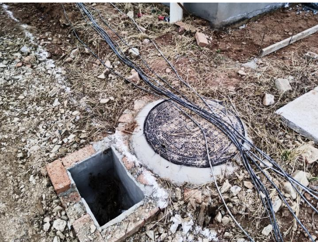
项目沉沙池和雨水井现状（拍摄时间2024年11月）