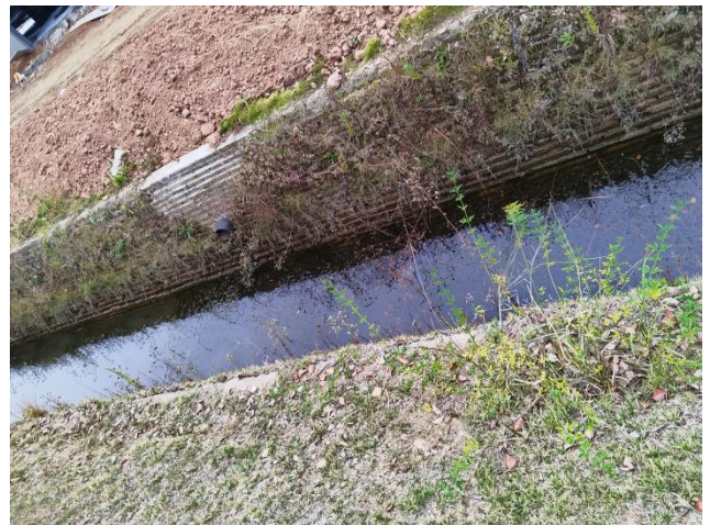
项目区北侧排水渠现状（拍摄时间2024年11月）