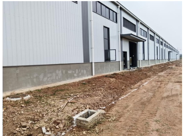
项目区建筑物区现状（拍摄时间2024年11月）